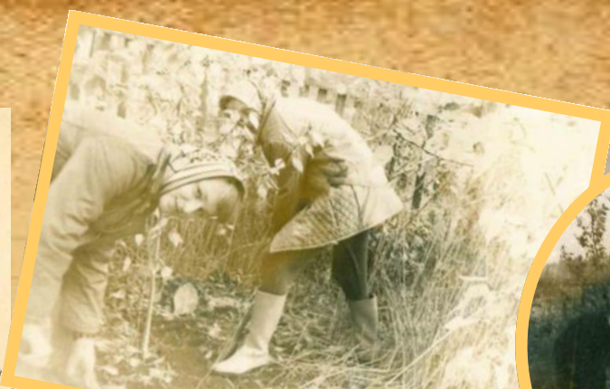
Посадка яблонь на пришкольном участке