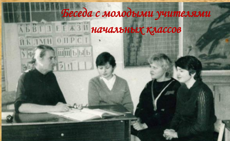
Беседа с молодыми учителями начальных классов